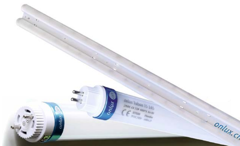
Für Beleuchtungsanlagen mit T5- oder T8-Röhren mit EVG bestehen «Kit-Lösungen» für die Umrüstung, beispielsweise die Tubon & Flaton 24V LED-Module mit Magnet-Haltern.

2. Technische Analyse: Das Beleuchtungssystem muss nach einer Erneuerung allen Vorschriften genügen. Die Umrüstung soll technisch wie ökonomisch klar vordefiniert sein und nach