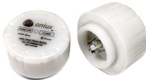
Intelligente, programmierbare Radar-Controller mit Schwarm-Funktion zum mehrstufigen Dimmen von Beleuchtungssystemen.